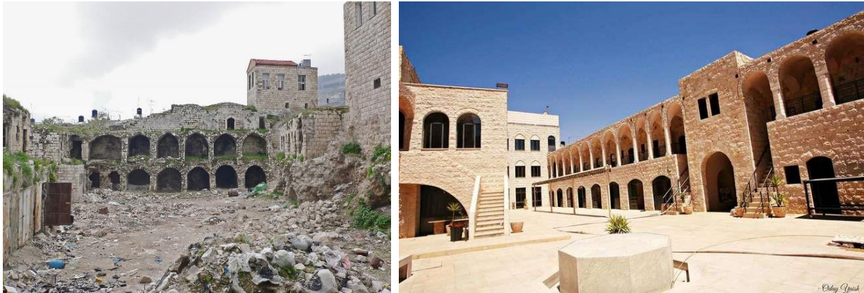
Rénovation de l'hôtel Khan al-Wakalah avant/après.